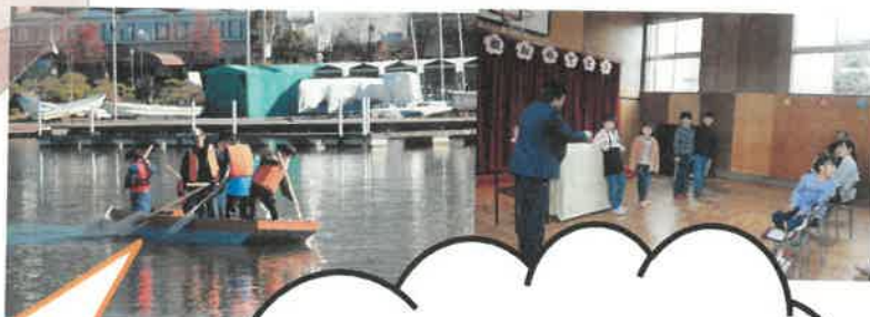
カヤック・ボート体験